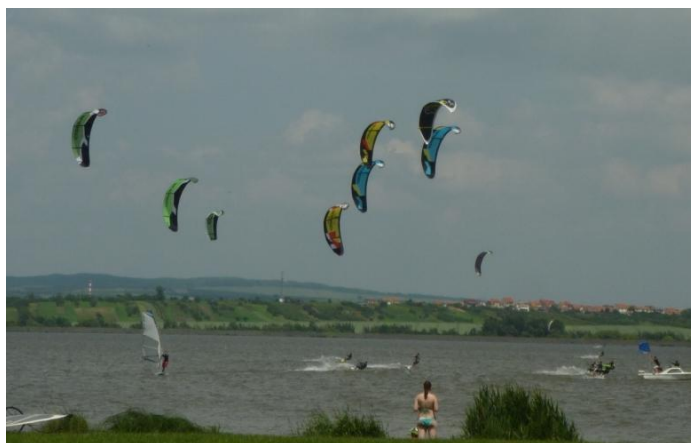
Start první rozjížděky