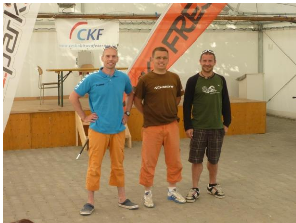
Vítězové závodu ve slalomu