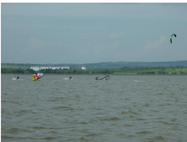
Vyřazení Poldy Trdého z boje nezávodícím expertem

V obou závodech se umístění v čele závodu, ale i ve zbytku pole tak míchalo, že až do vyhlášení výsledků si nemohl být výsledkem nikdo jistý.