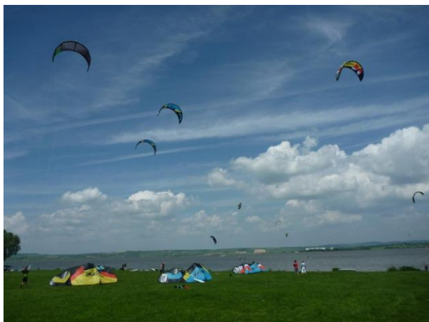
Mushow Kite Beach

Závody byly organizovány pod hlavičkou České kitové federace a již tradičně se na organizaci podílely kluby Kite Akademie, Funky Fresh a Yacht Club Dyje, technickou a zdravotní asistenci a pomoc zajišťovala VZS.