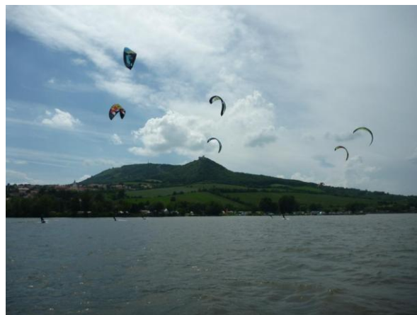
Počasí pro závod vyšlo ukázkově

Přestože závody byly vypsány jako dvoudenní, sobotní no-wind opalovačka odsunula i samotnou registraci do závodu a závod samotný na neděli, která slibovala od 12-ti hodin jihovýchodní vítr.