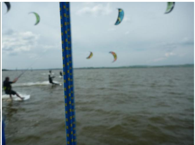
Start posledního heatu