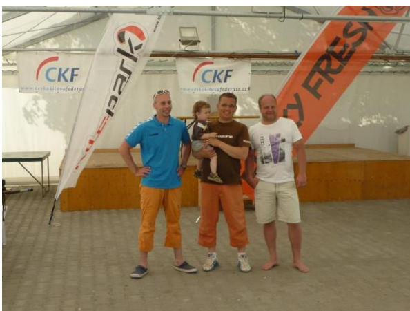
Vítězná trojice course race i celkového hodnocení závodu

Závěrem bychom rádi poděkovali všem, kteří se na závodech podíleli, podpořili ho a především těm, kteří se rozhodli jej odjet! Těšíme se na další setkání na příští session!