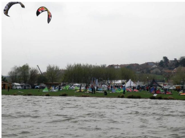
Pálavský Kite Fest

Celá akce pak byla zároveň součástí Pálavského Kite Festu, jehož pořadatelé a vystavovatelé podpořili závod nejen propagačně, ale i finančně, za což jim patří velké díky!