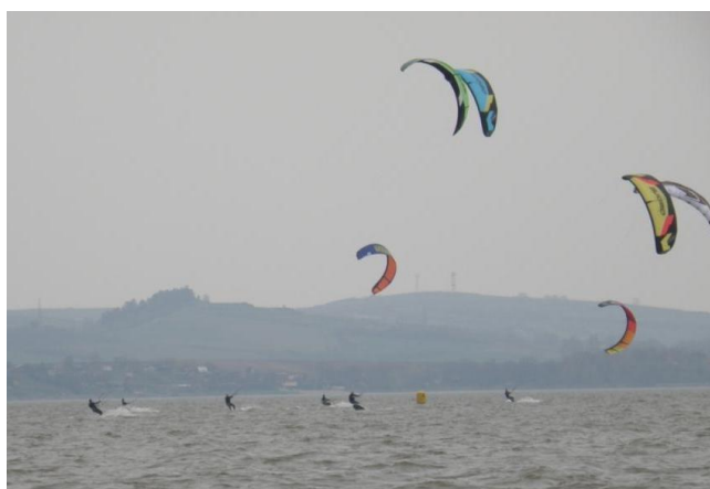
Točka kolem první bóje