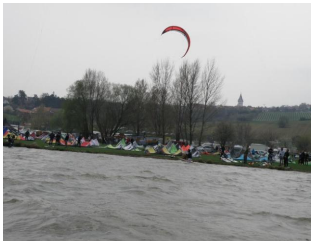
Pálavský Kite Fest