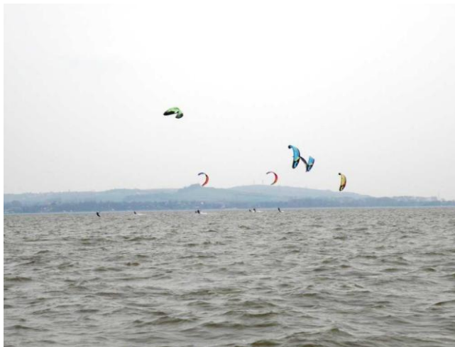
Stoupačka na první bóji

Před hodinovou pauzou se odjely 4 rozjížd'ky. Všechny měly velice podobný průběh při větru zhruba 8 - 10 uzlů, místy zesilujícím na 10 - 13 uzlů. Závodní pole naprosto ovládly raceboardy Michala Diviše a Milo Chalupníka, které v kombinaci se 17ti, respektive 19ti metrovými kity nedávaly zbytku startovního pole příliš šancí. Aby z čela závodu byla „two men show“ dovolil i třetí příčky atakující Filip Ševčík, pro něhož byl závod ve znamení ladění vybavení. Big respect pak Marku Vlachovi, který dokázal špici závodního pole pronásledovat na klasickém twintipu se čtrnáctimetrovým kitem. I s tímto „handicapem“ dokázal odjet polovinu rozjížděk a uvelebit se na čtvrtém místě.